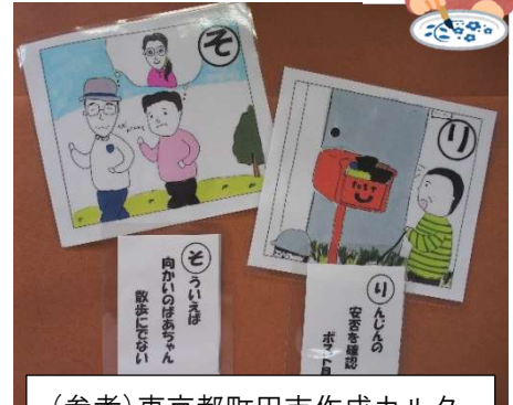
(参考)東京都町田市作成カルタ

「どんなイラストを描けばいいかイメージしづらい…」という方には、社協に見本をご用意しています。貸出や閲覧もできますので、どうぞお気軽にお声かけください。