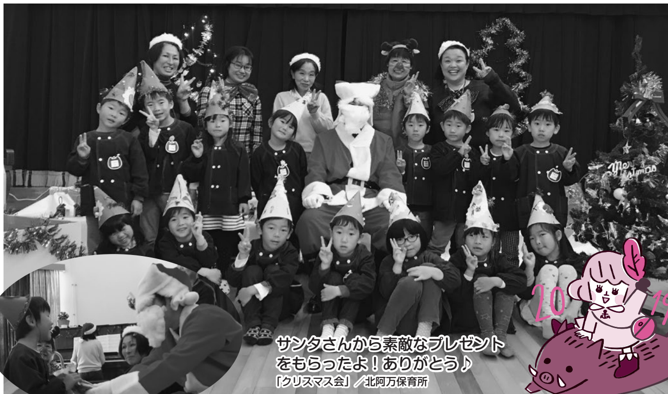
サンタさんから素敵なプレゼント をもらったよ！ありがとう♪ 「クリスマス会」／北阿万保育所